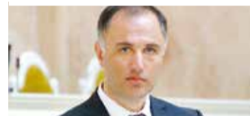
Марат Оганесян, вице-губернатор Санкт-Петербурга по строительству:

– Отраднo, что мы пришли к подписанию соглашения о взаимодействии между Государственной инспекцией труда в Санкт-Петербурге и саморегулируемой организацией, но у нас в городе не одна саморегулируемая организация в сфере строительства, и поэтому в существующую проблему необходимо вовлекать остальные СРО строительной сферы и всех участников строительного рынка. Только после такой масштабной акции и общей работы, начало которой сегодня было положено, мы получим положительный эффект в виде спасенных жизней.