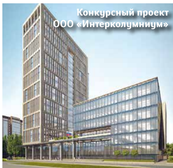
Конкурсный проект ООО «Интерколумниум»