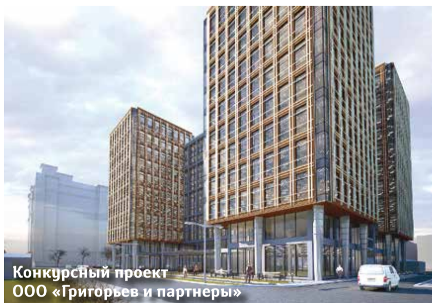
Конкурсный проект ООО «Григорьев и партнеры»