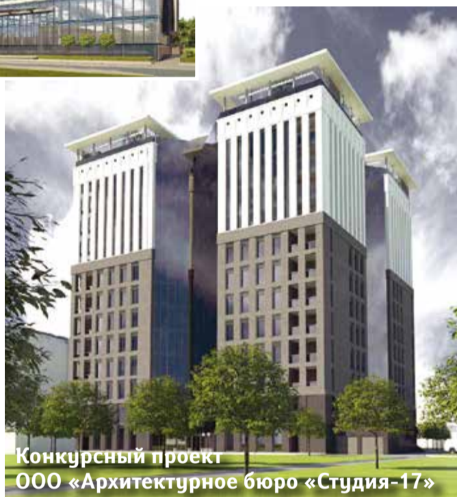
Конкурсный проект ООО «Архитектурное бюро «Студия-17»

Новый бизнес-центр класса А будет построен на Варшавской улице. Инвестор – ООО «Потенциал-Инвест» – планирует полностью реализовать проект летом следующего года. Для строительства административного комплекса определен участок площадью 6440 кв. м, расположенный севернее дома № 7, литера А по Варшавской улице.