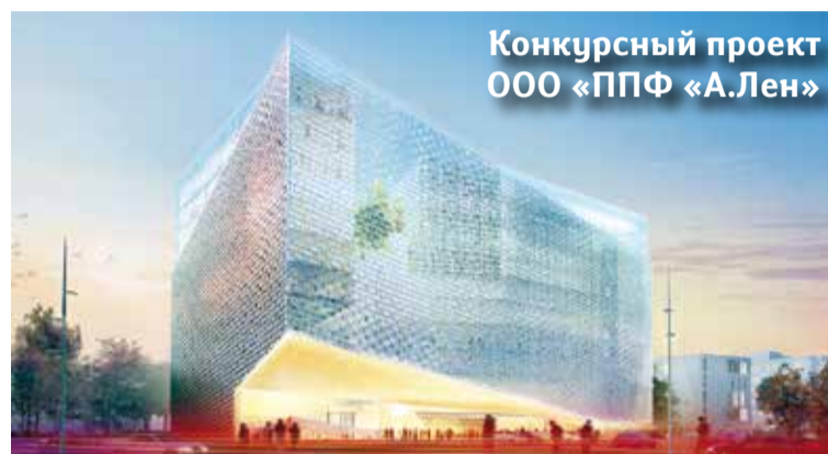
Конкурсный проект ООО «ППФ «А.Лен»