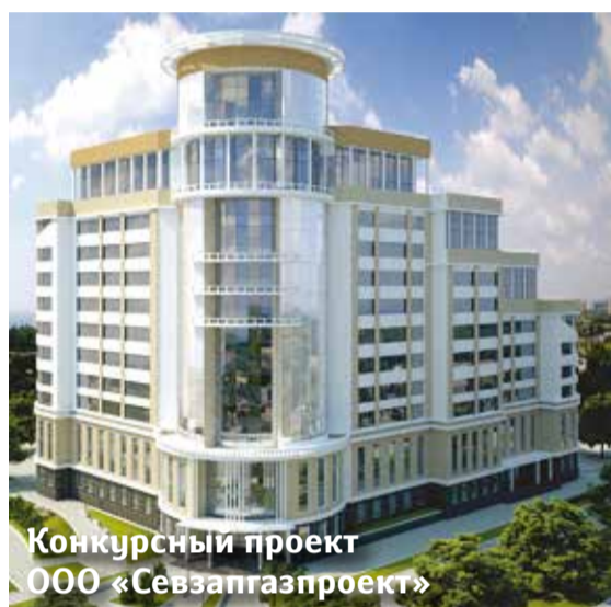
Конкурсный проект ООО «Севзагазпроект»

Девелоперская компания «Потенциал-Инвест» определилась с обликом бизнес-центра, который будет построен в Московском районе. Архитектурой нового офисного здания, по итогам закрытого конкурса, проведенного в конце июля, займется петербургское бюро «Григорьев и партнеры».