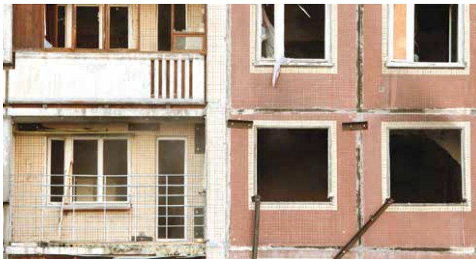
В РЕЗУЛЬТАТЕ ВЗРЫВА ЧАСТИЧНО ОБРУШИЛАСЬ ЛОДЖИЯ НА ЧЕТВЕРТОМ ЭТАЖЕ (КВАРТИРА 227)

МУРЭП «Пороховые» приняло меры по восстановлению доступных конструктивных элементов (остекление окон на лестничных клетках со второго по девятый этаж). Закрыты проемы, образовавшиеся после взрыва по шахте лифта. Убран и вывезен мусор в размере 70 куб.м. ЗАО «Росстройинвест» и ОАО «КБ ВиПС» приступили к выполнению работ.